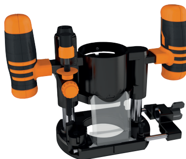
CMT12-A2 BASE AD AFFONDAMENTO + GUIDA DI SUPPORTO