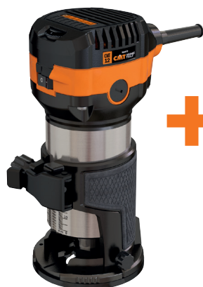
CMT12 RIFILATORE 710W